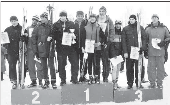
Пераможцы сярод арганізацый.